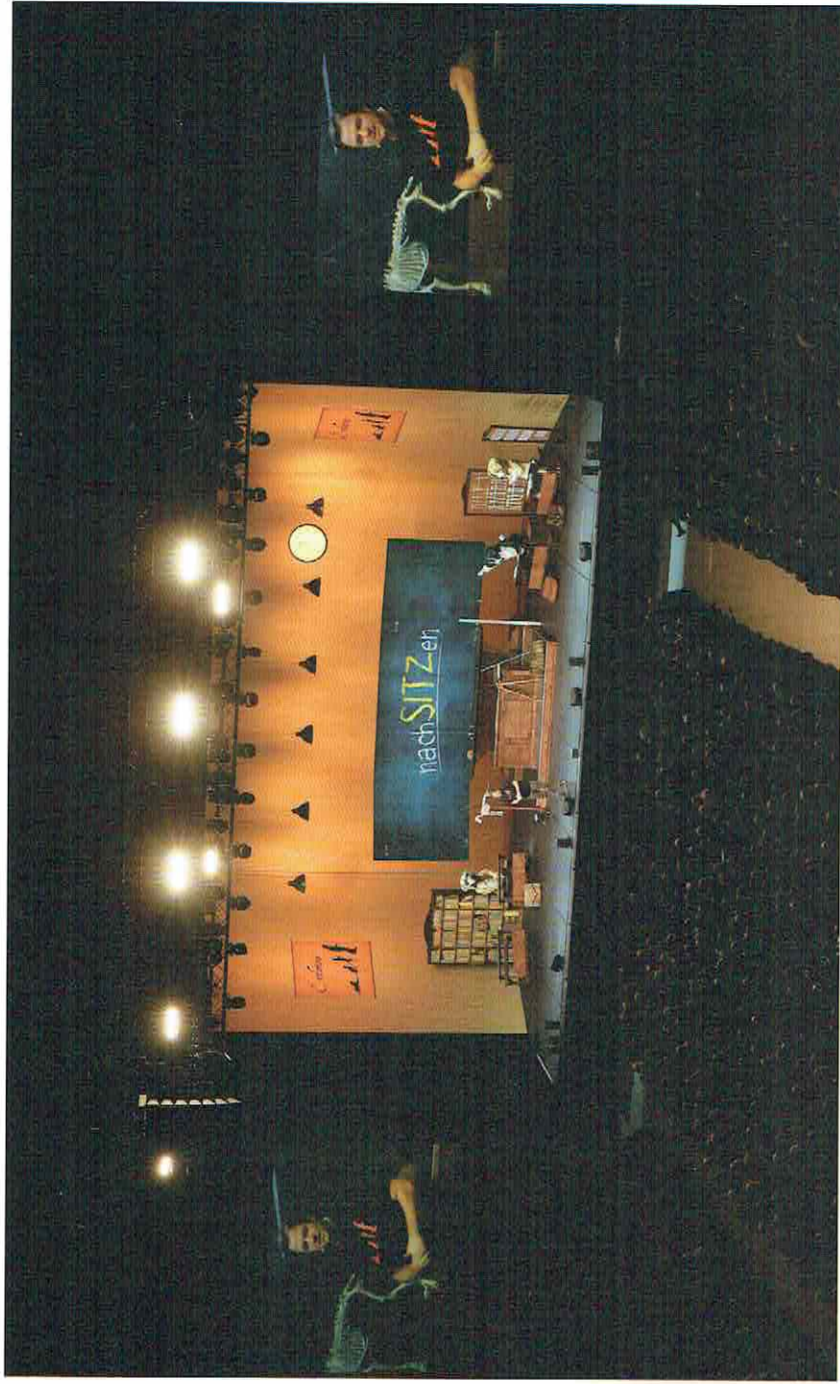
LIVE-TOUR. Der „Dogfather“ der Hundezucht mit seinem Programm „nachSITzen“.

▲ sensibel sind. Feingefühlige Hunde können nämlich insbesondere bei Familien mit Kindern zu einem Problem werden, denn Kinder sind im Umgang mit Hunden nicht gerade zimperlich.