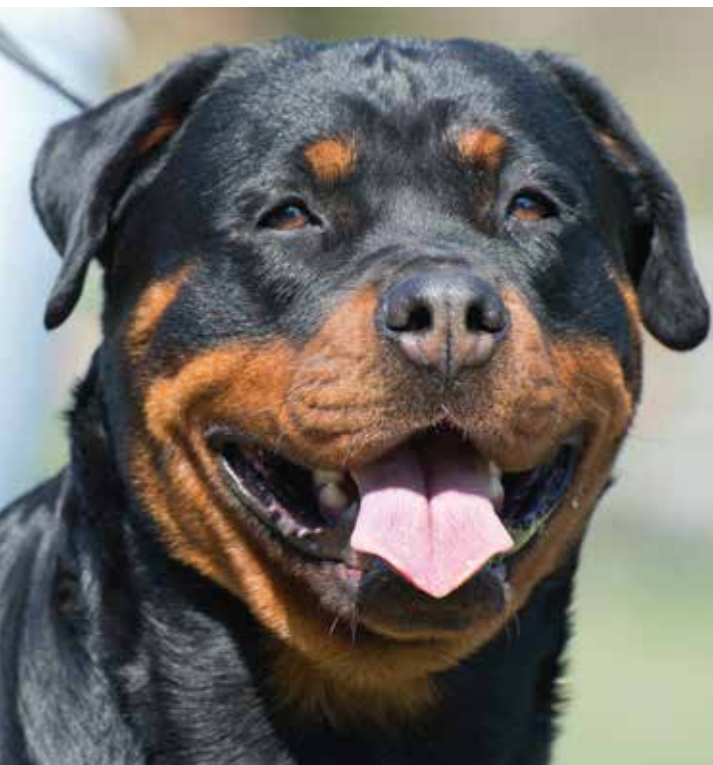
› DER ROTTWEILER GEHÖRT ZU DEN TREIBHUNDEN UND IST DESWEGEN SEHR ROBUST UND KERNIG.

Rassen: Rottweiler, Entlebucher Sennenhund, Australian Cattle Dog, Welsh Corgie u. v. m.