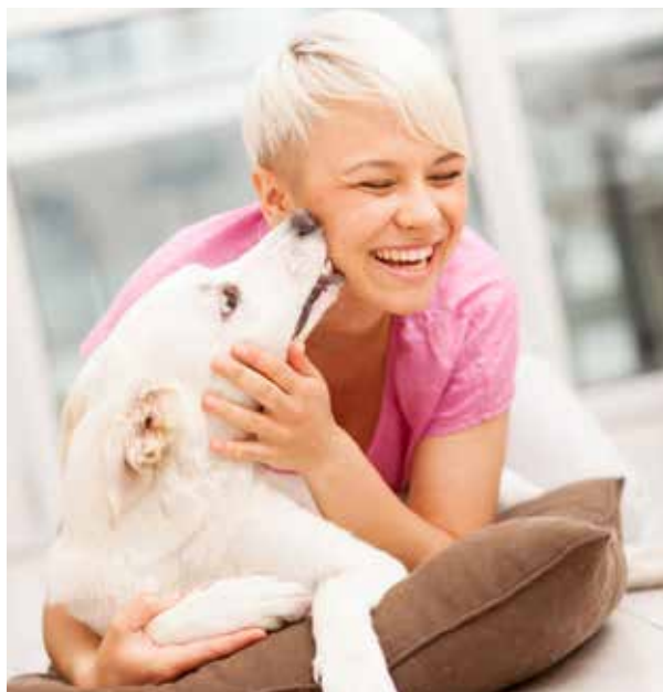
› HUNDE WÜRDEN IMMER DIE NÄHE DES MENSCHEN SUCHEN UND BRAUCHEN DESHALB KEIN GROSSES HAUS MIT GARTEN

Wahrscheinlich einer der größten Irrtümer der Hundehaltung überhaupt. Wie vorher schon erwähnt, ist der Hund ein echter Sozialpartner des Menschen geworden, der eng und vertraut mit ihm zusammenlebt. Das heißt auch, dass bei einem großen Haus mit 20 ha Grundstück und 250 qm Wohnfläche ein Hund mit guter Beziehung zum Menschen trotz der Weitläufigkeit automatisch die Nähe seines Halters sucht. Befindet sich die Familie beispielsweise im Wohnzimmer, wird der Hund trotzdem immer bestrebt sein, dabei zu sein – egal ob er 50 kg hat oder nur 8 kg. Ein Hund wird also die Bewegungsfreiheit in einem so großen Haus nicht mehr schätzen und nutzen, als in einer 50-qm-Wohnung mitten in der Stadt. Generell hat auch die Natur vorgesehen, dass die „Höhle“ ein Rückzugsort zum Schlafen und Energietanken ist, in der man sich sozusagen in Ruhe auf den nächsten Jagdausflug vorbereiten kann. Lässt man den Hund dann in den großen Garten, wird er das Platzangebot ebenso nutzen wie jenes, das ihm auch auf der Hundeweise zur Verfügung steht. Mit einem Vorteil: Es ist für den Menschen bequemer, seinen Vierbeiner „mal eben“ in den Garten zu lassen. Folglich empfinde ich es für den Hund sogar oft als Nachteil, einen großen Garten zur