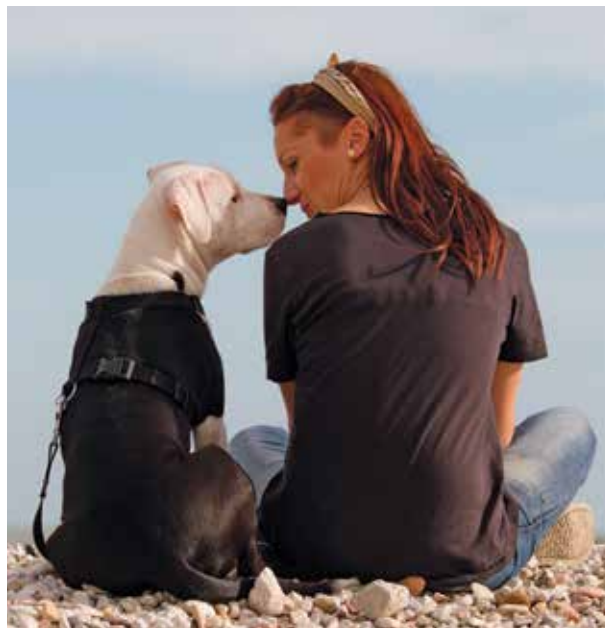
› SOG. „KAMPHUNDE“ KÖNNEN TOLLE BEGLEITER DES MENSCHEN SEIN

Hier muss nichts beschönigt werden: Kampfhunde wurden ursprünglich zum Kampf gezüchtet! Allerdings nicht gegen Menschen, sondern gegen Tiere wie Bären, Bullen, Ratten oder leider auch andere Hunde. Daher kommen auch die Namen vieler Hunde dieser Rassen: „Pitbull“ zum Beispiel, setzt sich aus „Pit“ (=Kampfarena) und „Bull“ (=Stier) zusammen. Dazu muss aber auch betont werden, dass in England, woher die meisten dieser offiziell „doggenartig“ genannten Hunde stammen, bereits 1835 Hundekämpfe verboten wurden. Dies hatte aber leider zur Folge, dass sich das beliebte Schauspiel in die USA und andere Länder verlagerte. Bis