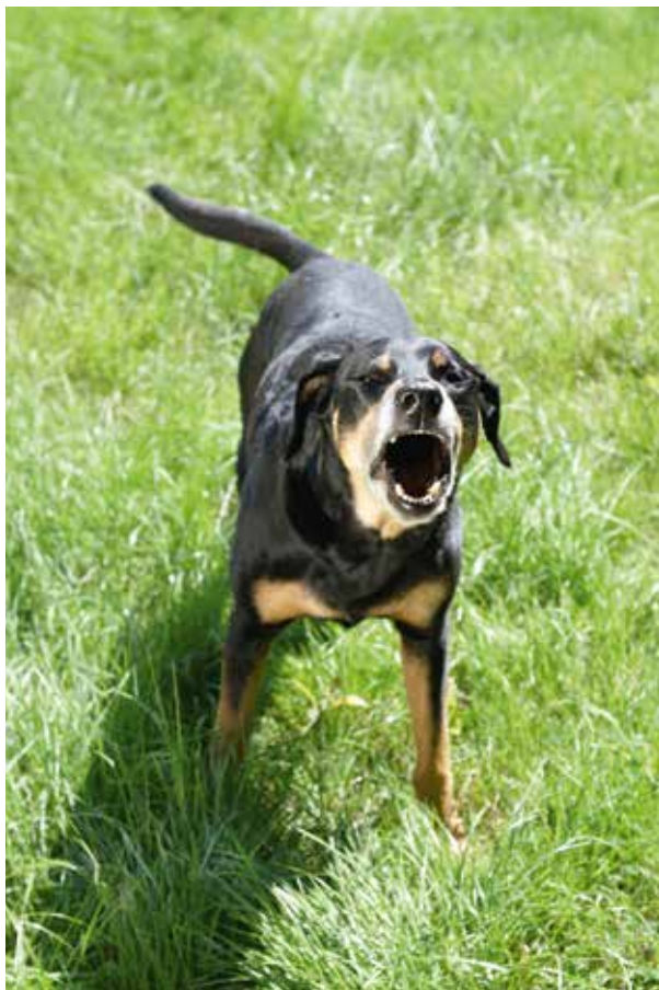
› SCHWANZWEDELN IST NICHT IMMER EIN AUSDRUCK VON FREUDE

sexuelle Erregung – wenn beispielsweise ein Rüde auf eine attraktive Hündin trifft und von der Rutenspitze viele kleine vibrierende Bewegungen ausgehen, oder auch unsichere Erregung – wenn die Rute ziellos in alle möglichen Richtungen schwingt. Gut ist aber, dass sich die Stimmung des Hundes durchaus über die Haltung und Bewegungen der Rute erkennen lässt. So ist ein freundliches, beschwichtigendes Wedeln, welches häufig zur Begrüßung gezeigt wird, eher tief angesetzt. Je höher die Rute getragen wird, desto mehr möchte der Hund imponieren und folglich auch Duft aus seinem Analbereich verteilen, das Wedeln ist dieser Absicht dienlich. So ziehen Hunde wiederum bei Angst oder Unsicherheit die Rute ja oft auch bis zum Bauch ein, um diese Duftverteilung eben möglichst zu vermeiden und nicht auf sich aufmerksam zu machen. Manche Rassen haben anatomisch geformte Ruten, die sich wie automatisch über den Rücken biegen. Dennoch können sie ihre Rute auch anders tragen, beim Schlafen hängt sie auch entspannt herunter. Man kann also sagen, dass diese Hunde eine