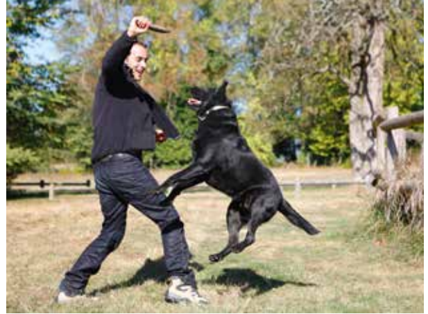
» ANSPRINGEN WIRD HÄUFIG VOM MENSCHEN BEWUSST ODER UNBEWUSST VERSTÄRKT.

verschiedenster Mimik, Gestik und Laute aus, die Gesamtheit dieser Elemente ermöglicht die Interpretation des Verhaltens. Wir Menschen brauchen übrigens keine Hundeflüsterer-Gabe, um diese Sprache zu verstehen. Sie ist erlernbar wie jede andere auch. «