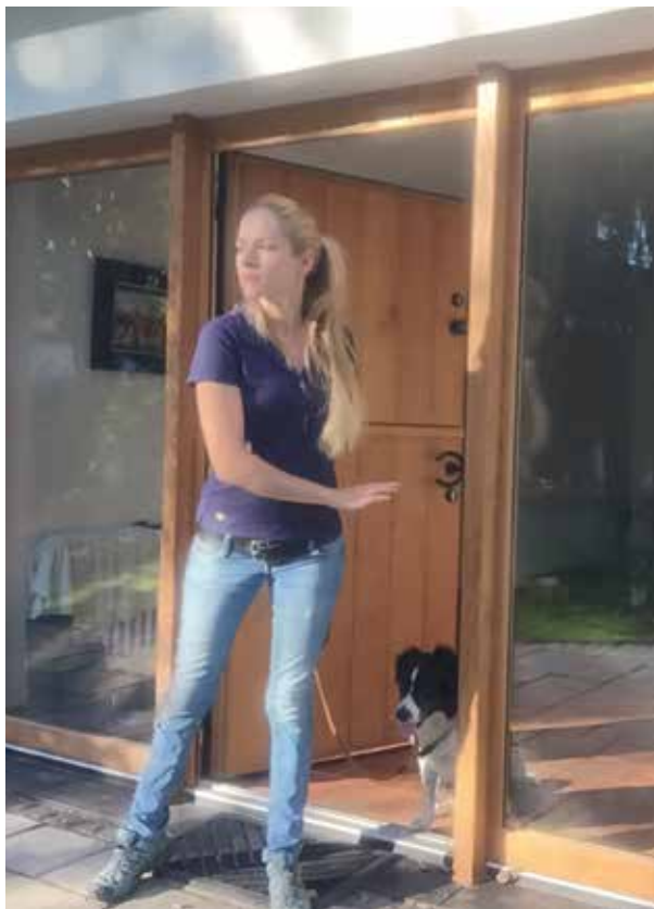
› WENN DER MENSCH ZUERST DURCH DIE TÜRE GEHT, DIENT DIES EINZIG DER TERRITORIALEN SICHERHEIT, DIE DEM HUND DADURCH VERMITTELT WIRD.

auch Hunde in der Natur tun. Und natürlich ist dort auch klar, wer Mama und Papa sind bzw. wer im Ernstfall das Kommando übernimmt und die Entscheidungen trifft. Dennoch dürfen die Kinder in einem menschlichen Familienverband auch ein Recht oder Privileg der Eltern genießen. Im Gegenteil: Die Einteilung und Verwaltung der wichtigen Ressourcen macht ja genau diese „Führungsqualitäten“ der echten Entscheider aus.