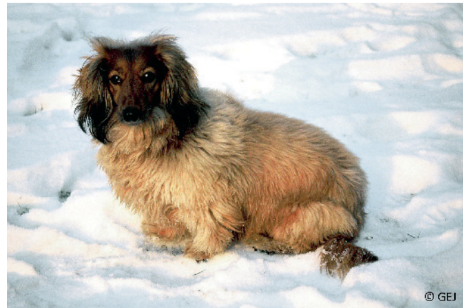
Abb. 3 Evidenzbasierte Daten zu Fellveränderungen als Folge der Kastration gibt es bisher nicht.

Trotz häufiger Berichte aus der Praxis über Fellveränderungen nach Kastration mit Inzidenzangaben von rund 20% gibt es keine evidenzbasierten Daten (113). Am häufigsten betroffen scheinen Hündinnen langhaariger Rassen mit seidigem oder glänzendem Deckhaar und/oder roter Fellfarbe zu sein wie Irish Setter, Cocker Spaniel und Langhaardackel. Bei kurzhaarigen Rassen kommen Fellveränderungen deutlich seltener vor. Eine saisonale Flankenalopecie wurde vereinzelt bei kastrierten Boxern, Airedale Terriern und Englischen Bulldoggen beschrieben. Ob der Kastrationszeitpunkt in Relation zur Pubertät eine Rolle spielt, wird kontrovers diskutiert (71, 114). Therapieoptionen bei Hündinnen sind abgesehen von der oralen Estrioltherapie die Applikation eines Deslorelinimplantats, dessen Wirkmechanismus allerdings bisher ungeklärt ist (98).