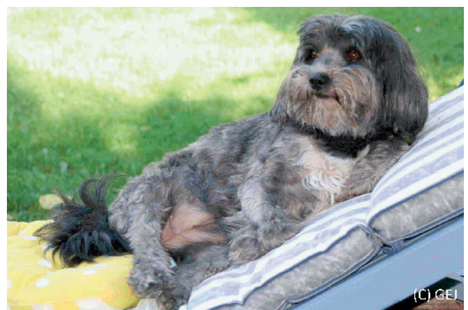
Abb. 2 Übergewicht konnte in Studien nicht einheitlich als unerwünschte Folge der Kastration nachgewiesen werden. Hier scheinen auch haltungsbedingte Einflüsse eine Rolle zu spielen.

Diabetes mellitus (DM) ist mit Prävalenzangaben von 0,3 % bis 1,3 % eine der häufigsten kaninen Endokrinopathien. Beim Hund werden 50 % der DM-Fälle dem Typ-1-Diabetes (früher auch als insulinabhängiger Diabetes bezeichnet) zugerechnet, der durch einen Insulinmangel aufgrund einer immunvermittelten Zerstörung der Beta-Zellen des Pankreas entsteht (91). Die übrigen Diabetesfälle beruhen auf einer Zerstörung des Pankreas (28 %) (2) wie z. B. bei chronischer Pankreatitis, auf einer chronischen Insulinresistenz wie sekundär bei Hyperadrenokortizismus oder auf dem gestagenbedingten DM. Letzterer tritt in der Progesteronphase trächtiger wie auch nicht trächtiger Hündinnen auf und entsteht durch eine progesteroninduzierte temporäre Insulinresistenz. Bei diabetischen Hündinnen ist die Kastration und damit die Entfernung der Progesteronquelle ein wichtiger Bestandteil der Behandlung und somit medizinisch indiziert. Da nach der Kastration praktisch kein Risiko für den gestagenabhängigen DM vorliegt, wäre zu erwarten, dass kastrierte Hündinnen seltener von DM betroffen sind als intakte Hündinnen. Populationsstudien zeigen jedoch entweder keinen Effekt der Kastration (44, 124) oder sogar