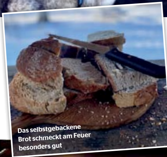
Das selbstgebackene Brot schmeckt am Feuer besonders gut