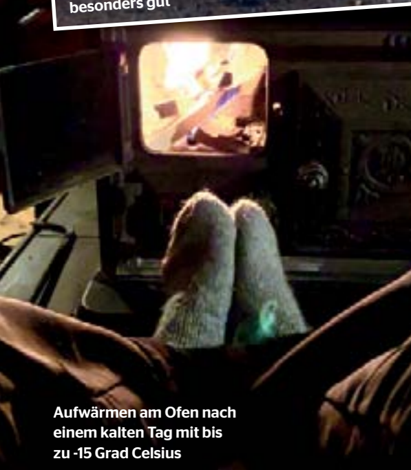
Aufwärmen am Ofen nach einem kalten Tag mit bis zu -15 Grad Celsius

mehr“, so Martin. Die Kommunikation der Huskies begeistert uns. Natürlich lässt sie schon mal ihr Aussehen sehr fein mimisch kommunizieren. In der taktilen Kommunikation sind vor allem die Youngsters dafür überdeutlich. Mal eine fordernde Pfote da, mal ein Anspringen bis zu den Schultern dort. Viel Kommunikation mit dem Maul untereinander. Ein Paradies für uns gerne beobachtenden Verhaltenstrainerinnen, das muss man schon sagen.