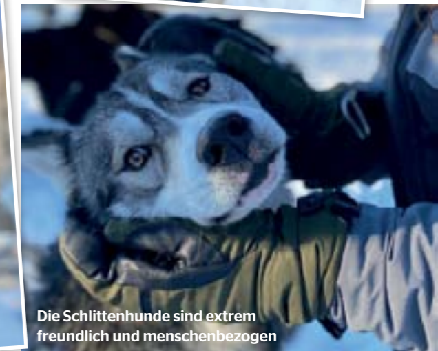
Die Schlittenhunde sind extrem freundlich und menschenbezogen

weiter auf die Seite, sollten sie zu nah an der Lauftruppe sein. Die erste Fütterung brachte uns definitiv auch ins Staunen. Erstens überraschte mich, wie verhältnismäßig wenig futtermotiviert die Hunde waren.