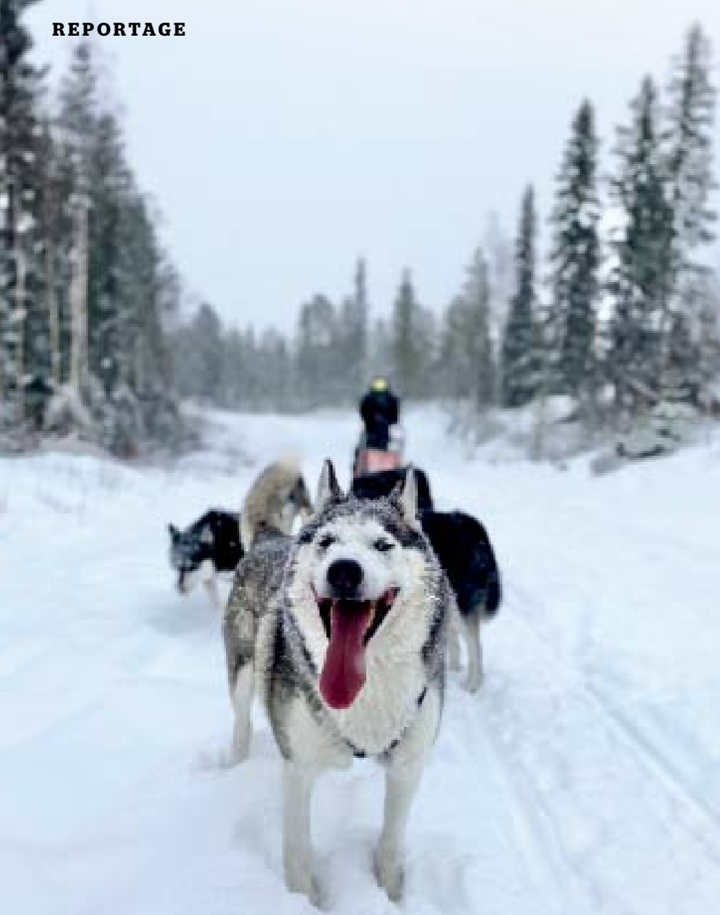
Die Schlittenhunde lieben es einfach in ihrem Element gefordert zu werden