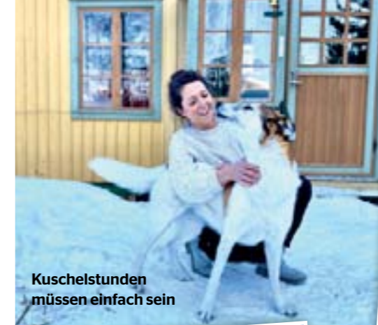
Kuschelstunden müssen einfach sein