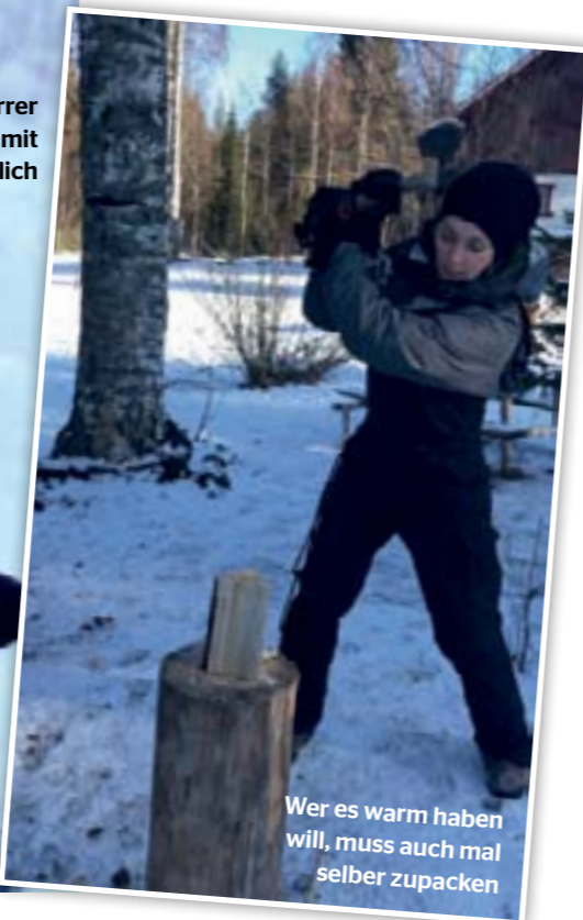
Wer es warm haben will, muss auch mal selber zupacken