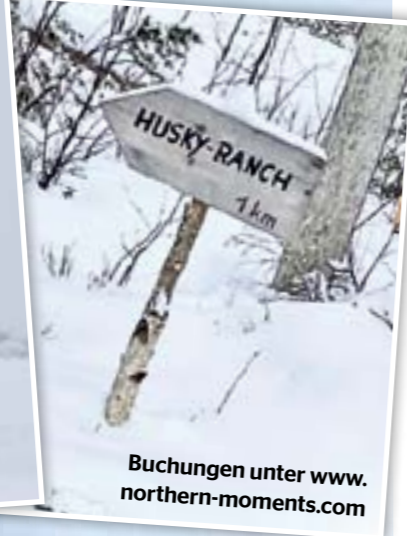
Buchungen unter www.northern-moments.com

sie rar gehalten wird. (Tipp für Zuhause) Die Huskies, die übrigens großteils aus Martins eigenen Würfen stammen, aber vereinzelt auch Tierschutzfälle sind, können „links“, „rechts“, „langsam“ und „steh“ – „mehr müssen sie auch nicht können“, lacht er. Unser Fotowunsch mit allen Hunden und „Sitz und Bleib“ sollte also unerfüllt bleiben.