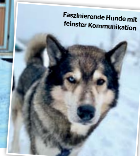
Faszinierende Hunde mit feinsten Kommunikation