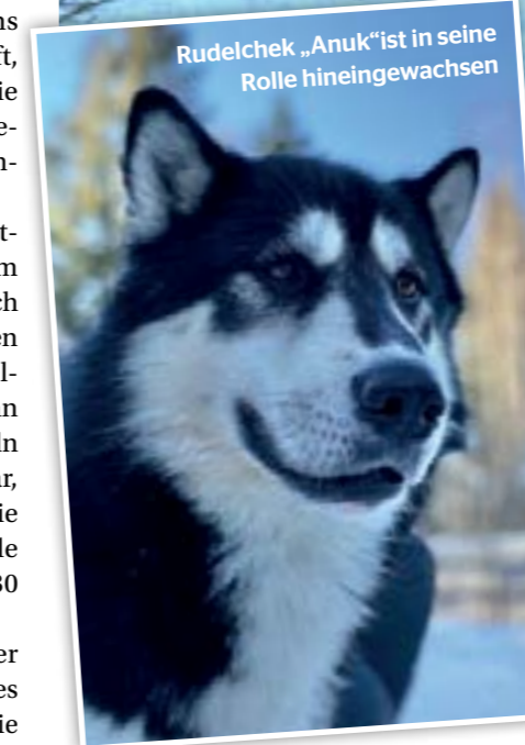
Rudelchef „Anuk“ ist in seine Rolle hineingewachsen